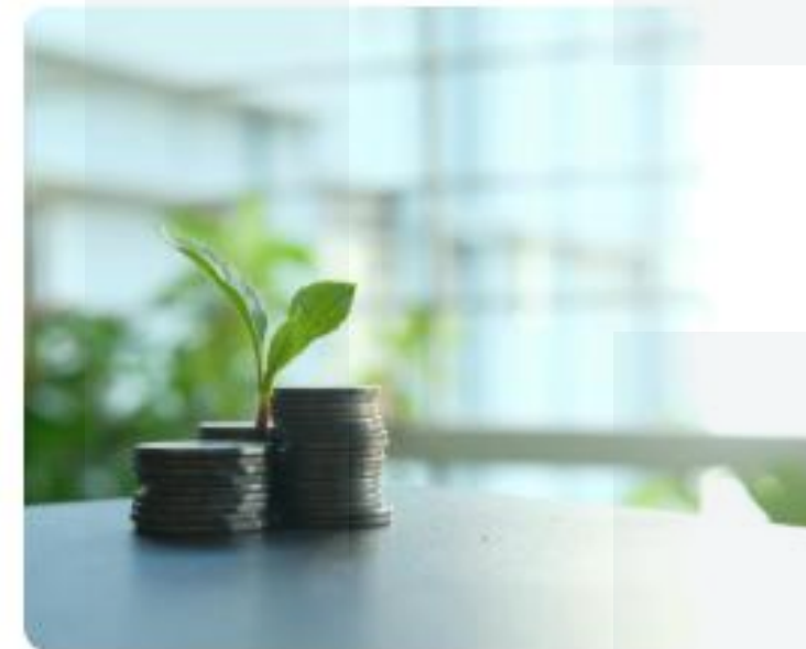
Cotización con Rentabilidad Protegida