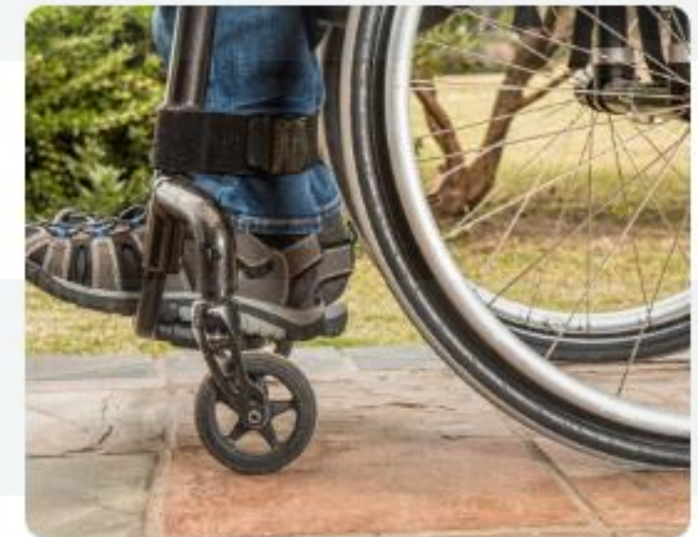
Seguro de Invalidez y Sobrevivencia