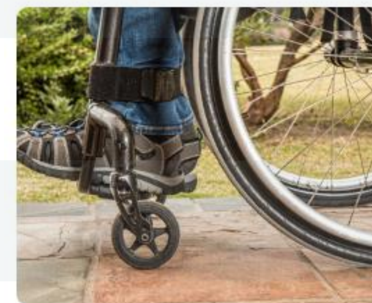
Seguro de Invalidez y Sobrevivencia