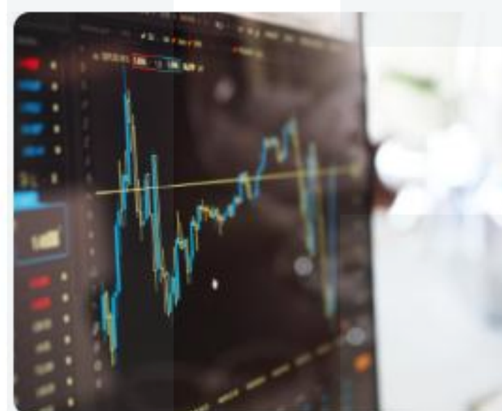
Cotización con Rentabilidad Protegida