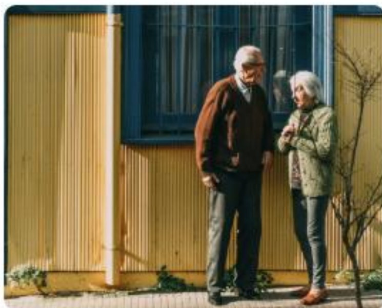
Beneficio por Años Cotizados

El Fondo Autónomo de Protección Previsional fue creado por la Ley N° 21.735 y tiene como objeto financiar, de manera sostenible, las prestaciones y beneficios de carácter contributivo, así como los complementos por brecha de género, contemplados en el Seguro Social Previsional.