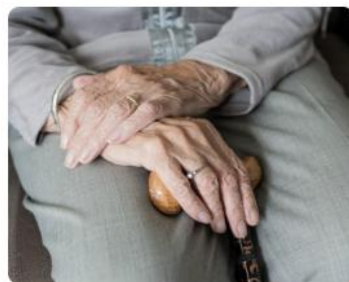
Beneficio para Mujeres por Mayor Expectativa de Vida